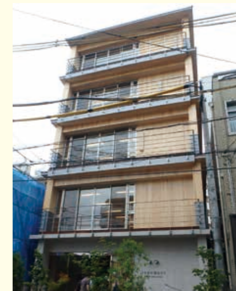
ぷろぼの福祉ビル【奈良県】

▶ 1階を鉄筋コンクリート、2階~5階をCLTパネル工法とすることで5階建てが実現!