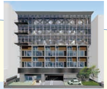
高知県自治会館新庁舎 ○3FまでRC(鉄筋コンクリート)造 ○4~6Fは木造軸組+CLT