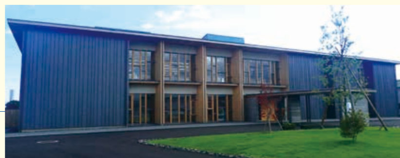
高知県森林組合連合会事務所【高知県】