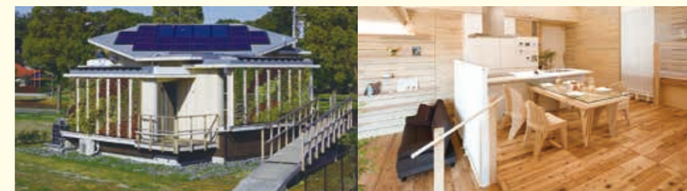
コエボハウス【東京都】⇒【神奈川県】 (健康の維持・増進、環境負荷の低減、安全・快適な社会を目指す慶応義塾大学の取組。解体・再組み立てが可能)