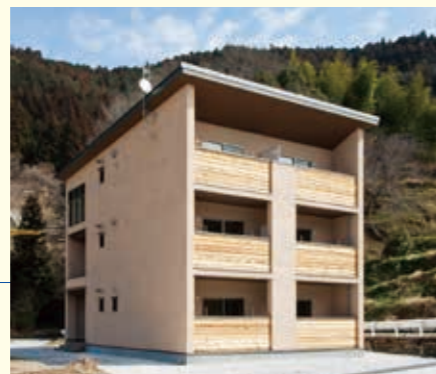
高知おおとよ製材(株)社員寮【高知県】