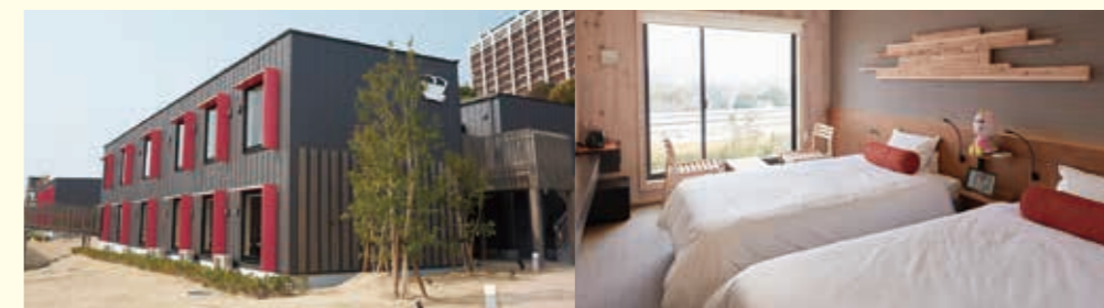
ハウステンボス「変なホテル」2期棟【長崎県】