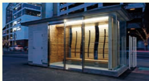
ハーバーランドバス駐車場CLT休憩所【兵庫県】