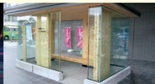
真庭市バス停【岡山県】