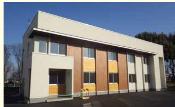
三井ホームコンポーネント(株)事務所【埼玉県】